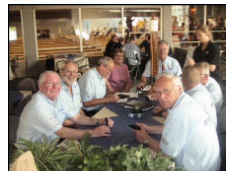
Jyllandsserie 2- Oldboysholdet hygger sig efter afslutningen på vinterens turnering.