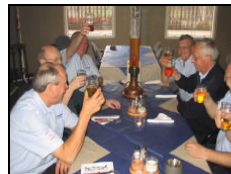
Serie 2 - Oldboysholdet fejrer deres guldmedaljer.