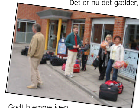
Godt hjemme igen