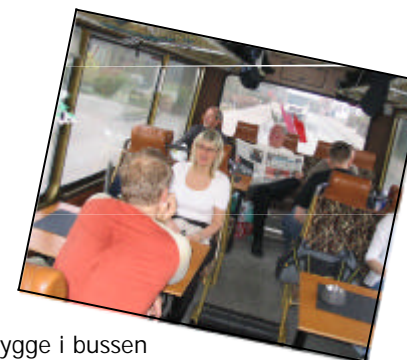
Hygge i bussen